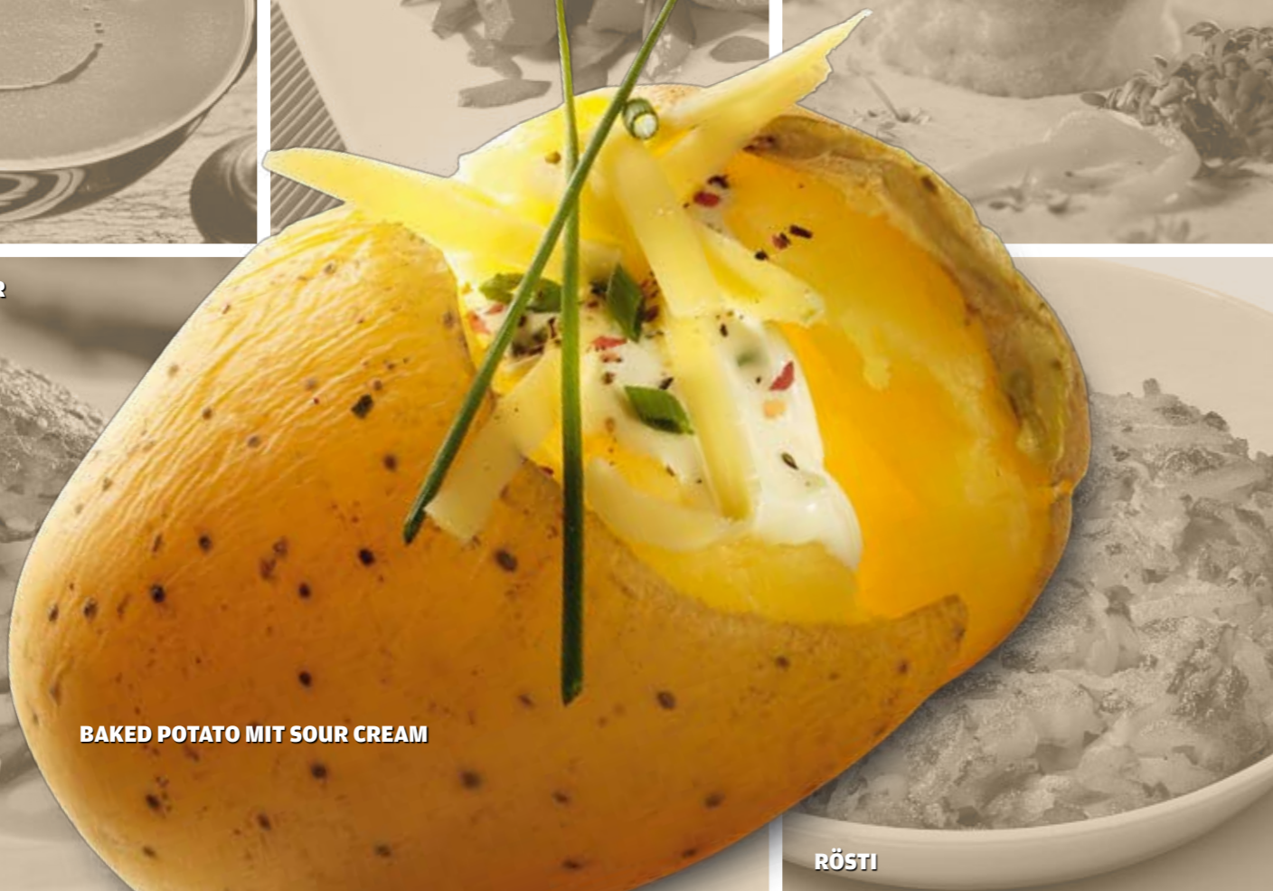
BAKED POTATO MIT SOUR CREAM